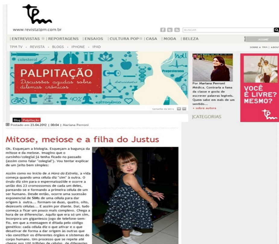
Figura 3 - Blog, Palpitação

onde é possível maior interação entre leitores, ganha contornos que também poderiam ser expressados no impresso. O que existe é apenas a mudança nos modos de se firmar os discursos, mesmo que divergentes. Os sentidos do mundo, assentados em valores e normas, expectativas e barreiras, definições e identidades, são assim constituídos em opinião pública, ciência, saúde, religião, leis, expectativas dos gêneros sociais, nas instâncias discursivas que regem e regulam a sociabilidade.