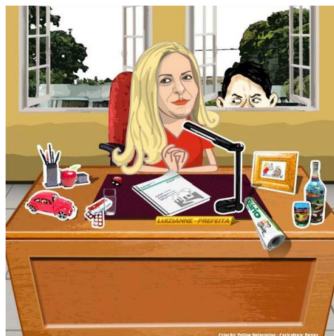
Figura 2 - Infográfico final sobre o governo da prefeita Luizianne Lins. Disponível em http://diariodonordeste.globo.com/noticia.asp?codigo=351909&modulo=963