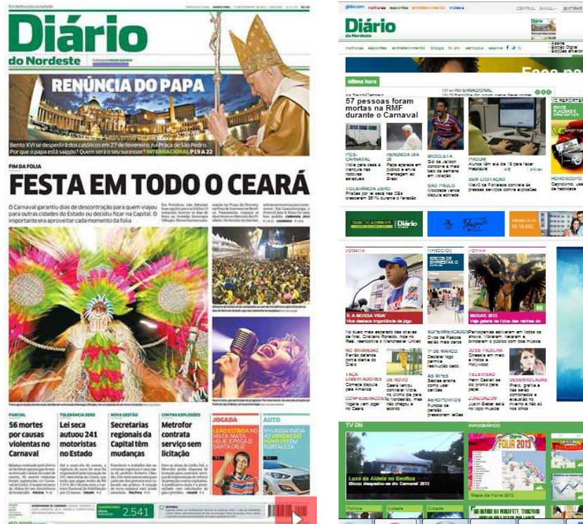
Figura 1- Identidade visual da Primeira Página e do site do DN

apresentasse como algo extremamente novo ou desconhecido, necessitaríamos de um período mais longo de execução do trabalho.