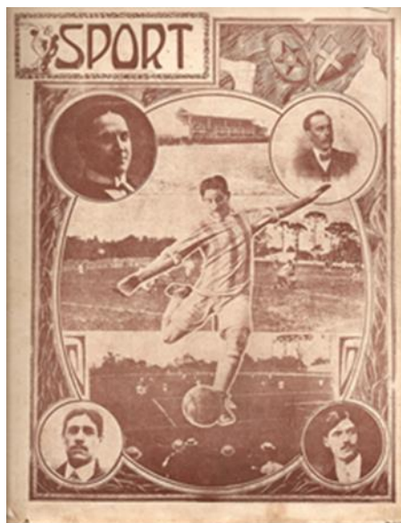
Figura 1: capa da revista Sport (1914). Reprodução/Arquivo Pessoal (Figuras 1 a 12)

Autointitulada um “Semanário Ilustrado”, Sport circulou de 8 de abril a, seguramente, 13 de agosto de 1914, data de sua última edição conhecida, a de número 19, cuja capa reproduzo aqui (figura 1).