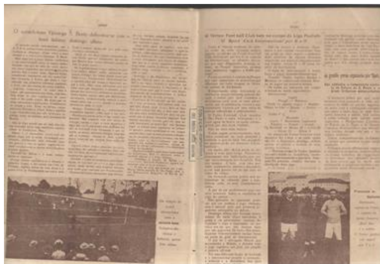
Figura 12: “instantâneo” de Palmeiras-Mackenzie versus italianos e Francezes x Italianos