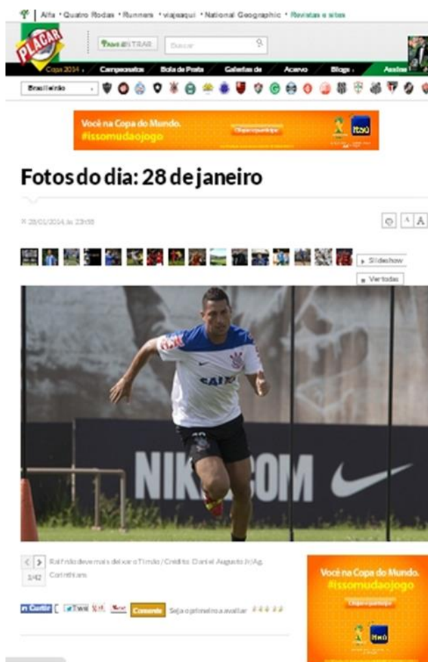
Figura 2: homepage da Galeria de Fotos de Placar (2014). Reprodução da página na internet

A cobertura dos jogos e do dia a dia dos times fica por conta do site da revista. Para suprir a demanda de informação imposta pelo tempo, Placar , originalmente um veículo impresso (como era Sport , em 1914), passou a contar com o auxílio de um braço eletrônico. Do ponto de vista da imagem, essa responsabilidade fica por conta da Galeria de Fotos de seu site ( www.placar.com.br/galeria ), atualizada ao final de cada dia com as principais imagens do futebol não só no Brasil, mas também no mundo, nas últimas 24 horas (figura 2). É esse o fenômeno que será aqui analisado, em comparação com as práticas de uma revista semanal que era publicada exatos 100 anos atrás.