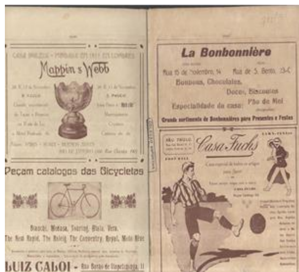
Figura 3: página dupla de anúncios em Sport

Os anunciantes eram casas comerciais (Mappin, loja de departamentos; La Bonbonnière, chocolates; Ausonia, “premiada fabrica de doces finos”), fabricantes de bebidas (Vermouth Martinazzi, vinho chianti Gambogi, Cinzano, Fernet Branca), empresas ligadas de alguma maneira ao esporte (Casa Fuchs, material esportivo; Luiz Caloi, bicicletas; pneus Pirelli e Dunlop; Pedro Baum,