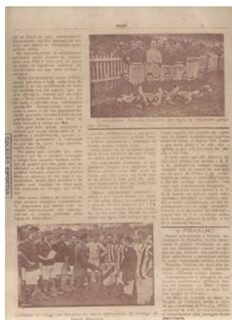
Figura 7: time posado Palmeiras-Mackenzie