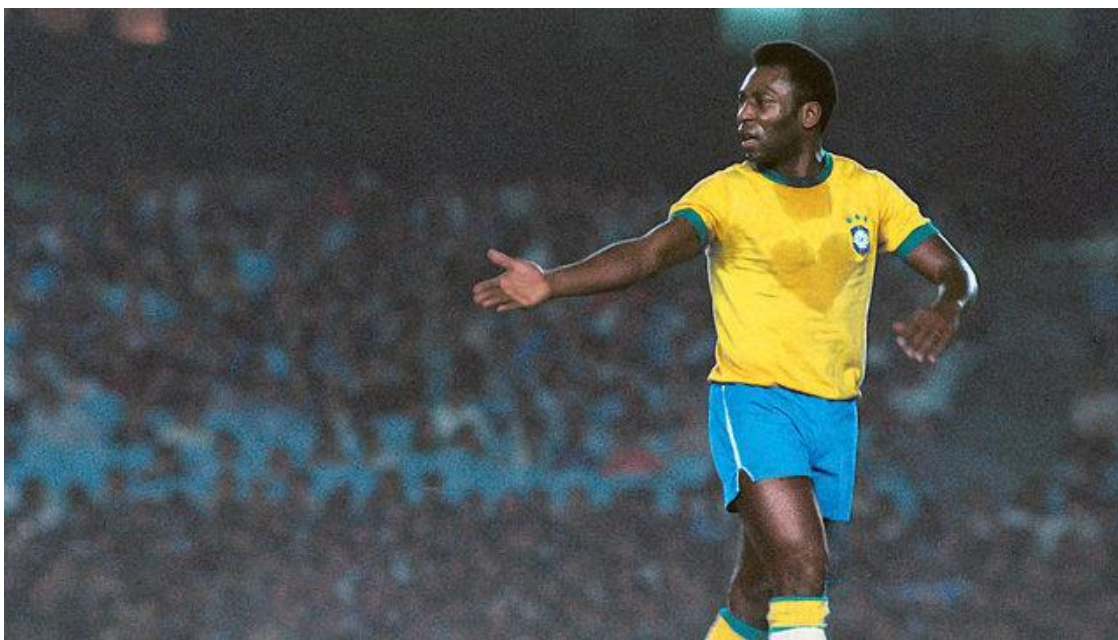
Figura 15: a clássica foto de Pelé, no retângulo que vem sendo publicada há 37 anos

Um caso recente, retirado da própria Galeria de Fotos de Placar do dia 21 de janeiro de 2014, exemplifica essa ação reducionista dos retângulos/janelas. Sobre a legenda “Placar revela quando, onde e como a imagem do coração de Pelé foi produzida”, o site (re)apresenta uma das mais famosas fotos do Rei do Futebol, da autoria de Luiz Paulo Machado. Nela, o ex-jogador aparece em campo, vestindo a camisa da Seleção Brasileira, com uma mancha de suor no peito, incrivelmente parecida com um coração (figura 15). Um texto explica que durante 36 anos essa foto foi reproduzida pela própria revista e por outros veículos com “data de fabricação errada”, inclusive em um recém-lançado e caríssimo livro de luxo sobre a vida de Pelé, voltado para colecionadores abastados e que está sendo vendido por valores entre 3.600 e 5.500 reais.