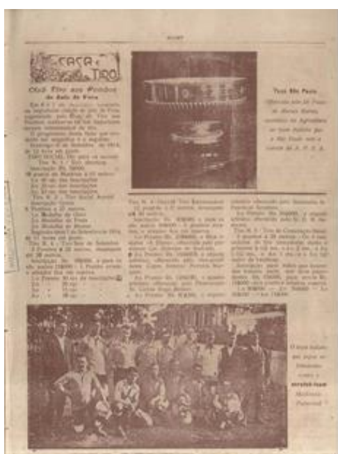
Figura 6: Pro Vercelli e taça

homenageiam personalidades: na oitava página, o capitão Luiz Lemaitre, da “missão franceza de instrução à força pública (atual polícia militar) do Estado”, ex-colaborador da própria revista (figura 10), e, na décima, o “Dr. Vittorio Pozzo, director da missão sportiva do Torino Foot-Ball Club”, futuro técnico bicampeão da Copa do Mundo (único até hoje), pela seleção italiana, em 1934 e 1938 (figura 5).