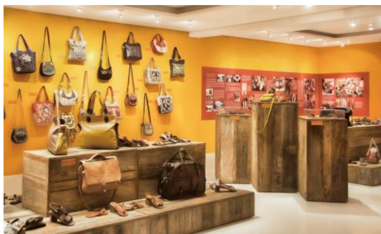
Exposição em São Paulo