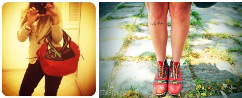
Blogs de Moda