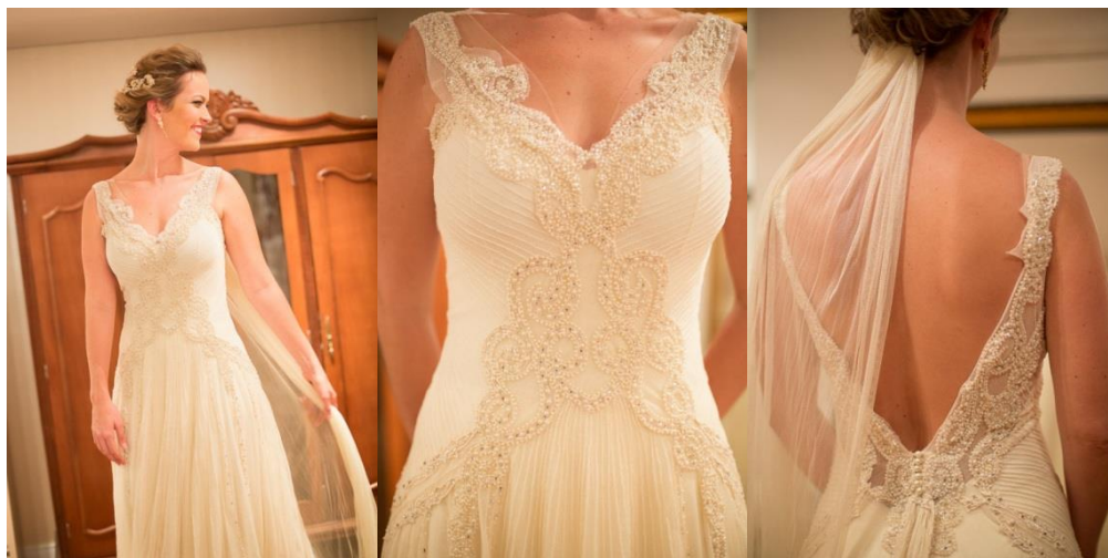
Vestido de noiva (Miss Mano)