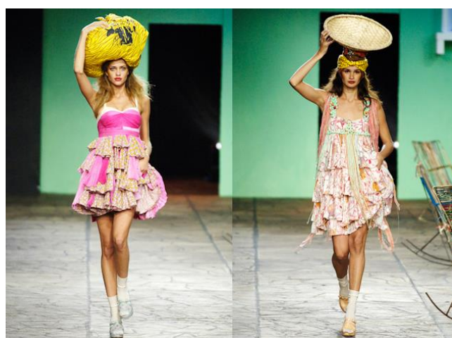
Desfile São Paulo Fashion Week 2006 (Cavalera)