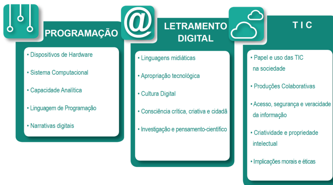
Figura 1: Três eixos norteadores do Currículo da Cidade de Tecnologias para Aprendizagem 8 .

TIC: a utilização dos recursos digitais disponíveis com a finalidade de informar e comunicar socialmente.