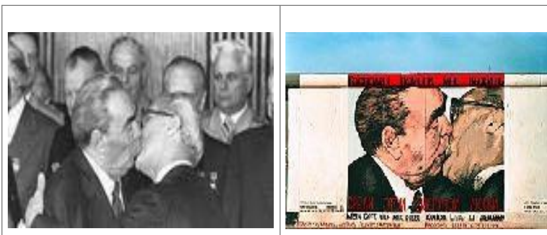
À esquerda, a fotografia; à direita, o grafite inspirado por ela.

O beijo fraternal era uma saudação especial de saudação dos líderes socialistas cujo objetivo era demonstrar que havia uma ligação especial entre os países do bloco. O registro fotográfico do encontro entre Leonid Brejnev, da União Soviética, e Erich Honecker, da República Democrática Alemã, tornou-se um ícone da cultura pop. Em 1990, a fotografia inspirou o grafite de Dmítri Vrúbel, aplicado no Muro de Berlim, denominado “Meu Deus, ajuda-me a sobreviver a esse amor mortal”. Sobre a ideia de ligação especial entre os países socialistas, pode-se afirmar que ela: